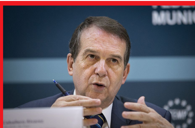
El presidente de la FEMP, el socialista Abel Caballero

La Federación de Municipios y Provincias (FEMP) ha anunciado que contempla convocar una reunión con todos sus órganos estatutarios para exigir de forma inmediata al Gobierno que "dé vía libre" a las entidades locales para reinvertir el superávit generado en anteriores ejercicios si finalmente no lo autoriza. En un comunicado, la FEMP indica que su presidente, Abel Caballero, ha planteado a la Junta de Gobierno de la