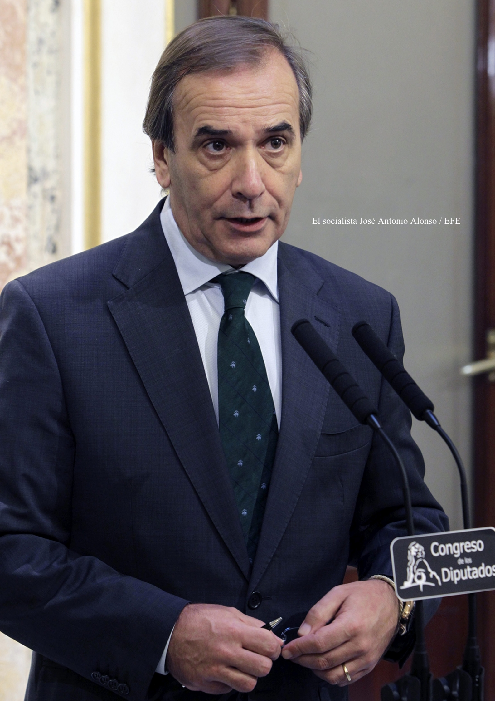
El socialista José Antonio Alonso