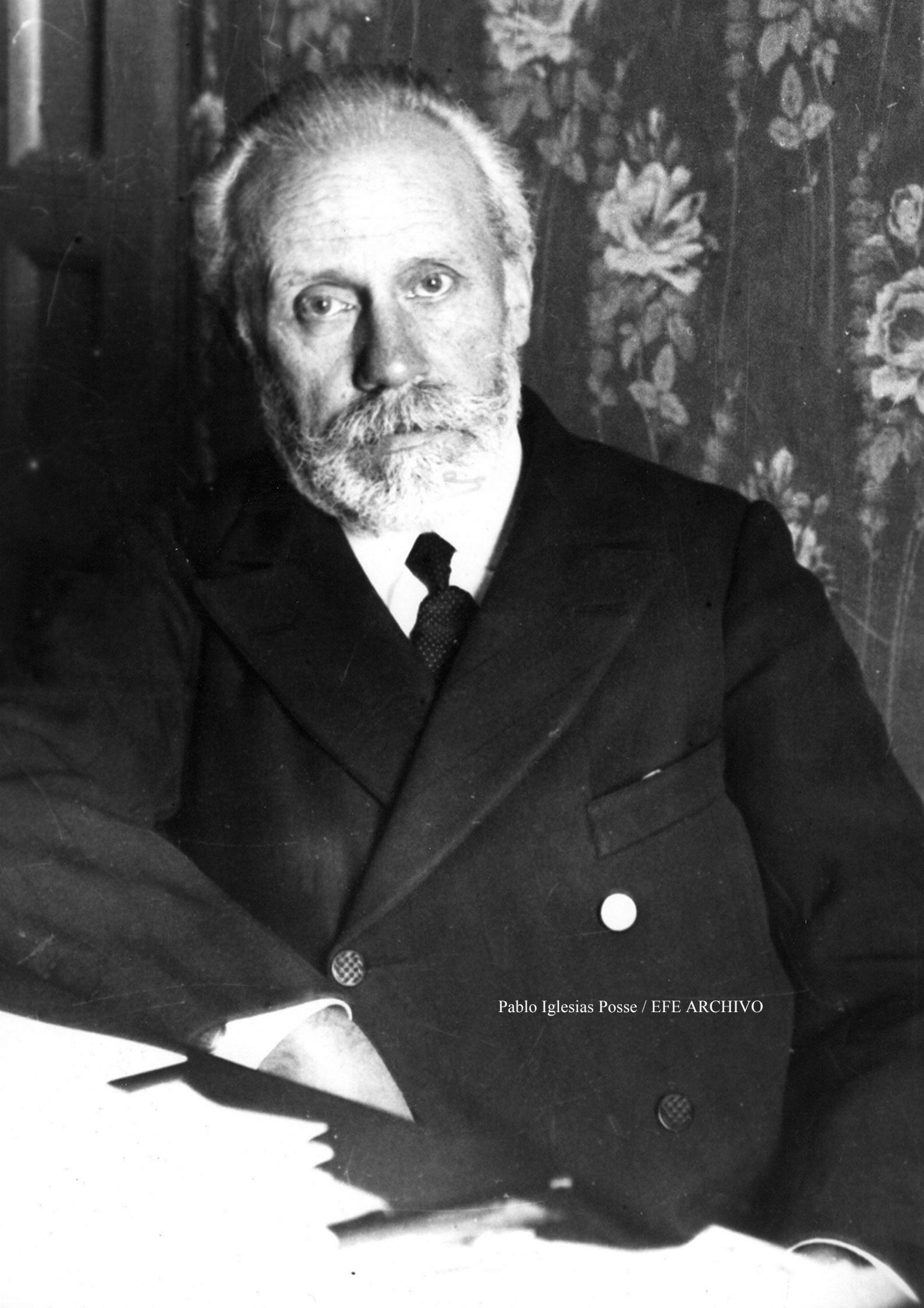
Pablo Iglesias Posse / EFE ARCHIVO